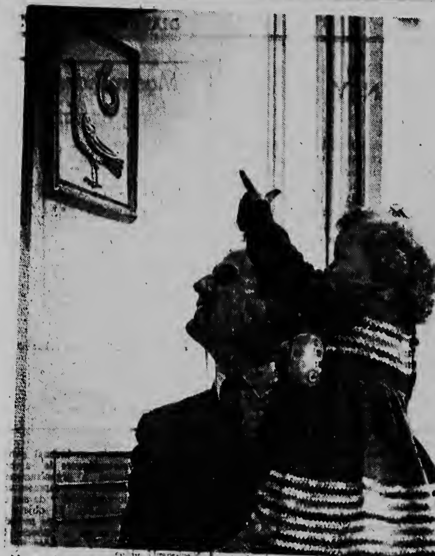
Na un bista riba e blok dje edificio nobo na Wiesbaden, no solemen e tranquilonan a larga pone un number na e habitacionnan, pero masha larga pone tambe un bestia of un planchi graba riba e parti decorativo dje conjunto, e metodo aqoi tin tambe un parti practico. Muchanan ta corda mas facil un bestia of un planchi cu un cijfer.

Awe nochi e mester a sali cun'e, pero e no por a spera te ora cu e hoben bin busk'e 7.30. El a bai na telefon den hadrij. Sra. Rochester a sali bai na Raetih pa e yuda Sherry un of dos seman awor cu esaki a sali hospital y Gabriela a calcula cu awor aqoi Paul lo ta trahando su sandwichnan na cas. Lo e pidic di bini cas cerca y bin come cun'e. Generalmente e no sa combida Paul di bini na su flat ora cu e tabata solitario. Esaki no tabata su intencion y e tabata sa tambe cu Paul tabata comprinde esai. Pero den e caso aqoi tabatin algo otro. Paul tabata solitario y e tambe tabata solitario y a demas di esai tabatin un motibo pa e larga jam'e tambe.